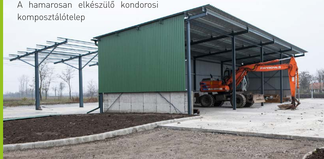
A hamarosan elkészülő kondorosi komposztálótelep

Akiknek gondot okoz az otthoni komposztálás, azoknak jó hír, hogy a Körös-szögi kistérség hulladékgazdálkodási programja keretében hamarosan minden városias társasházhoz kerül biokuka. Az így összegyűjtött zöld-hulladékot a közeljövőben a kondorosi komposztálótelepre szállítják, ahol univerzális erőgéppel, késes erőgép meghajtású komposztáló aprítóval és saját motoros meghajtású, kalapácsos komposztáló alapgéppel, illetve erőgép meghajtású komposzt rostával minőségi komposzt alapanyaggá dolgozzák át azokat. Néhány hónapos érést követően pedig el is készül a kiváló minőségű komposzt, azaz szerves trágya.